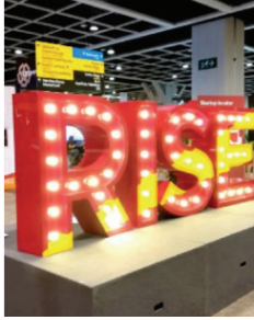
Technikmesse in Hongkong.

Nach der BLOCKSHOW ASIA in Singapur, dem Malta AI & BLOCKCHAIN SUMMIT, der MONEY20/20 Europe in Amsterdam sowie der OpenExpo Europe 2019 in Madrid und der CIBTC in Granada präsentierte sich die THE STONE COIN letzte Woche erfolgreich an der mit über 16,000 Besuchern grössten asiatischen